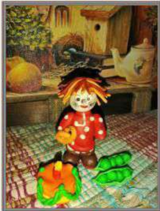
Конкурсная работа: «Домовёнок Кузя» Возрастная категория от 7 до 9 лет

Организатор конкурса: S-BA.RU Свидетельство о регистрации СМИ: ЭЛ № ФС 77 - 70095 Лицензия на образовательную деятельность №19556